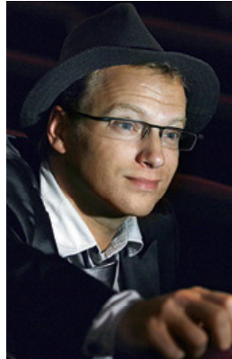
MACIEJ STUHR AKTOR