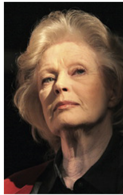
BEATA TYSZKIEWICZ AKTORKA