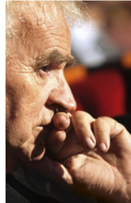
JANUSZ GŁOWACKI PROZAIK, DRAMATURG